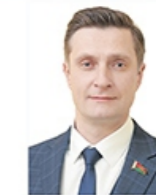
Министр культуры Чернецкий Руслан Иосифович