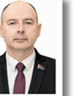
Министр энергетики Кушнаренко Алексей Иванович