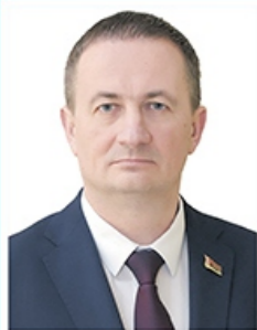
Турчин Александр Генрихович

Осуществляет непосредственное руководство деятельностью Совета Министров. Обеспечивает общее руководство и контроль за реализацией программы социально-экономического развития Беларуси, выполнением важнейших параметров прогноза социально-экономического развития страны, исполнением республиканского бюджета.