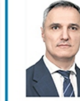
Председатель Белорусского производственно-торгового концерна лесной, деревообрабатывающей и целлюлозно-бумажной промышленности* Пшённый Александр Александрович

*Концерны имеют статус организаций, подчиненных Совету Министров.