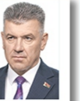
Министр лесного хозяйства Кулик Александр Антонович