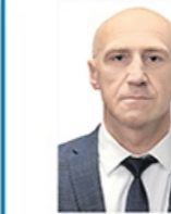
Министр жилищно-коммунального хозяйства Трубило Геннадий Алексеевич