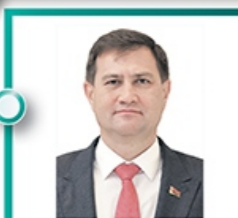
Министр иностранных дел Рыженков Максим Владимирович