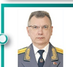
Председатель Государственного таможенного комитета Орловский Владимир Николаевич