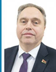
Караник Владимир Степанович

Курирует социальный блок Правительства: Министерство труда и социальной защиты, Министерство здравоохранения, Министерство образования, Министерство информации, Министерство спорта и туризма, Министерство культуры.