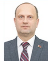
Министр экономики Чеботарь Юрий Адамович

Курирует экономический блок Правительства: Министерство экономики, Министерство финансов, МАРТ, Министерство по налогам и сборам, Министерство связи и информатизации, Госкомимущество.