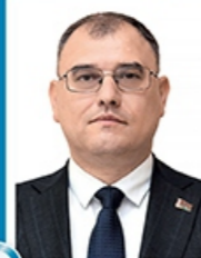
Каранкевич Виктор Михайлович

Курирует промышленный блок Правительства: Министерство промышленности, Министерство энергетики, Государственный военно-промышленный комитет, Государственный комитет по науке и технологиям, Государственный комитет по стандартизации, концерны «Беллегпром», «Белнефтехим», «Беллесбумпром».