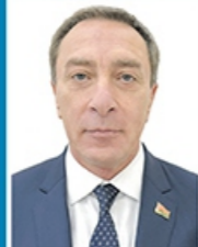
Снопков Николай Геннадьевич

Курирует экономический блок Правительства: Министерство экономики, Министерство финансов, МАРТ, Министерство по налогам и сборам, Министерство связи и информатизации, Госкомимущество.