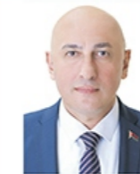
Министр информации Марков Марат Сергеевич