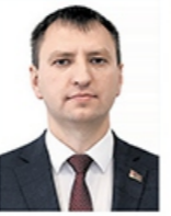
Министр промышленности Ефимов Александр Владимирович

Курирует промышленный блок Правительства: Министерство промышленности, Министерство энергетики, Государственный военно-промышленный комитет, Государственный комитет по науке и технологиям, Государственный комитет по стандартизации, концерны «Беллегпром», «Белнефтехим», «Беллесбумпром».