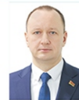
Министр по налогам и сборам Кийко Дмитрий Николаевич