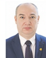
Министр здравоохранения Ходжаев Александр Валерьевич