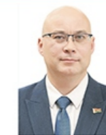
Председатель Государственного комитета по имуществу Матусевич Дмитрий Феофанович