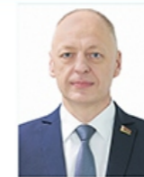
Министр антимонопольного регулирования и торговли Карпович Артур Борисович