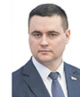
Министр образования Иванец Андрей Иванович