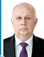
Сивак Анатолий Александрович

Курирует вопросы Министерства архитектуры и строительства, Министерства жилищно-коммунального хозяйства, Министерства транспорта и коммуникаций.