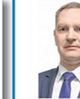
Министр транспорта и коммуникаций Ляхнович Алексей Алексеевич