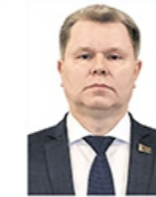
Министр архитектуры и строительства Студнев Александр Викторович

Курирует вопросы Министерства архитектуры и строительства, Министерства жилищно-коммунального хозяйства, Министерства транспорта и коммуникаций.