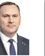
Председатель Белорусского государственного концерна пищевой промышленности «Белгоспищепром»* Жидков Олег Николаевич