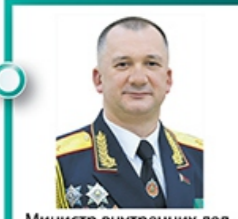
Министр внутренних дел Кубраков Иван Владимирович