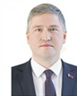
Министр связи и информатизации Залесский Кирилл Борисович